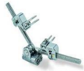
a. Distractor externo