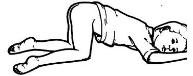
Figura 1. Niño recostado con la cara hacia abajo. Las rodillas y caderas están dobladas hacia el pecho.