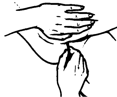
Figura 4: Meta la punta de la sonda al recto.