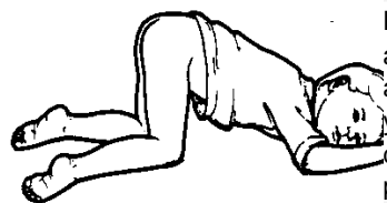
Figura 2: Niño acostado boca abajo. Las rodillas y la cadera están dobladas hacia el pecho.