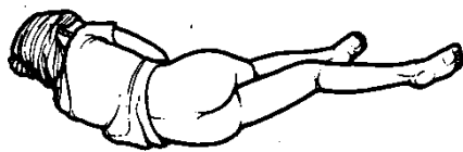
niño recostado sobre el lado izquierdo. Pierna izquierda estirada y pierna derecha doblada en la cadera y rodilla.