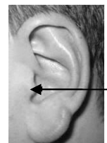
Trago (Fig 3)

ALERTA: Llame al médico de su hijo, a su enfermera o a la clínica si tiene cualquier consulta o inquietud o si su hijo tiene necesidades especiales de cuidados médicos que no se cubrieron en esta información.