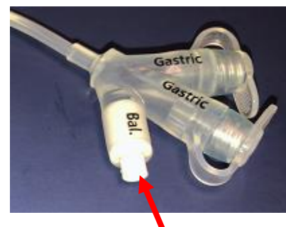
Puerto del globo