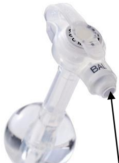
Puerto del globo