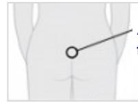
Área donde se puede formar el quiste