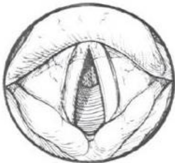
Cuerdas vocales abiertas