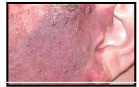
Color púrpura en un